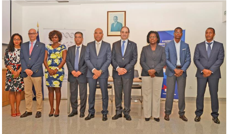
Direction de ENSA Angola Seguros

Les provinces angolaises de Huambo, Malanje et Bengo, ont été sélectionnées pour la phase expérimentale de l'assurance agricole, qui commencera à être vendue dans le pays au cours de la prochaine saison agricole (2017/2018), a annoncé le président de la compagnie d'assurance publique ENSA (ENSA Seguros de Angola).