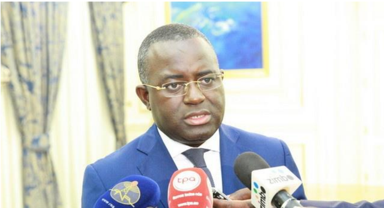
Valter Filipe Duarte da Silva, gouverneur de la BNA

La commission de la politique monétaire de la Banque nationale d'Angola a décidé de maintenir le principal taux d'intérêt de référence du pays, le taux de BNA, à 16%, ainsi que l'absorption de liquidité de 20% et le taux de liquidité de sept jours à 7,25% par an, selon les déclarations de la banque centrale.