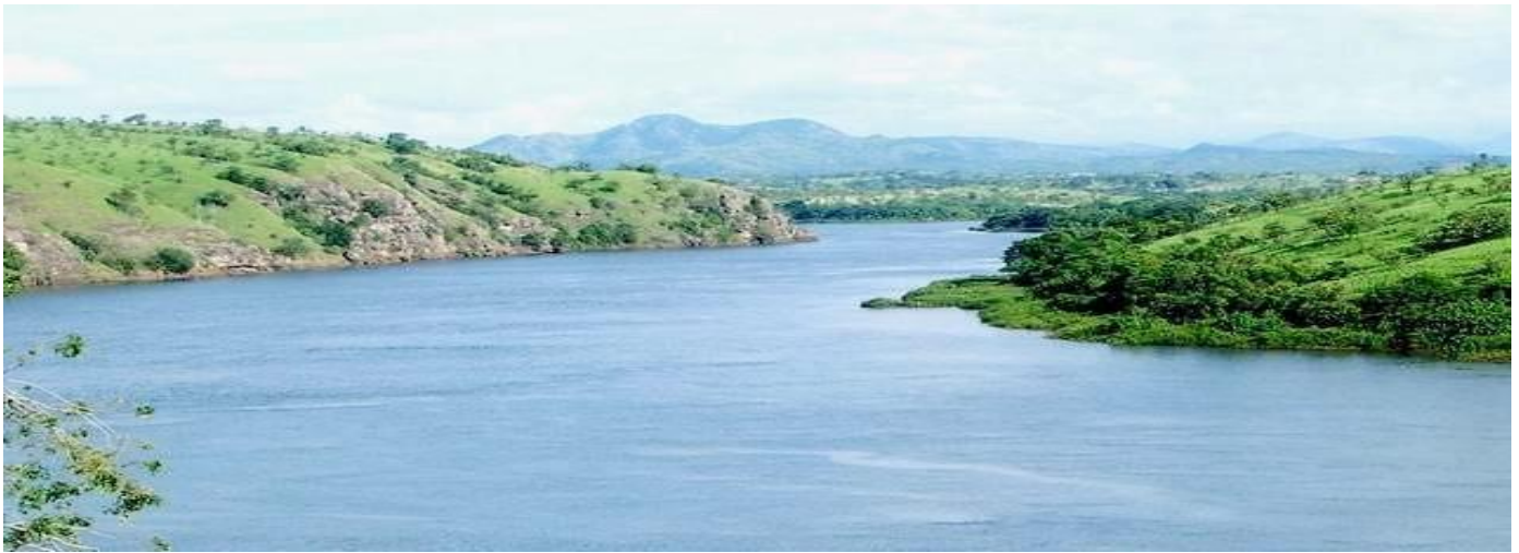
Vue sur le fleuve Kwanza

La compagnie nationale Sonangol a découvert des réserves de pétrole et de gaz dans les bassins des fleuves Kwanza et Congo. Dans un communiqué publié en avril, elle a précisé que lesdites réserves peuvent atteindre 2,2 milliards de barils d'équivalent de pétrole.