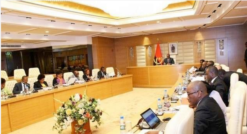
Le vice-président de l'Angola entouré des membres de la Commission pour la politique sociale du Conseil de Ministres

La Commission sur la politique sociale du Conseil des ministres a examiné mardi 10 mai dernier, un projet de décret présidentiel portant création du Conseil national d'action sociale. Le Conseil proposé remplacera le Conseil national de l'enfant et le Conseil national des personnes handicapées. Il sera un organe de concertation sociale et de suivi des politiques publiques pour la promotion et la défense des droits des enfants, des personnes handicapées et d'autres groupes vulnérables.