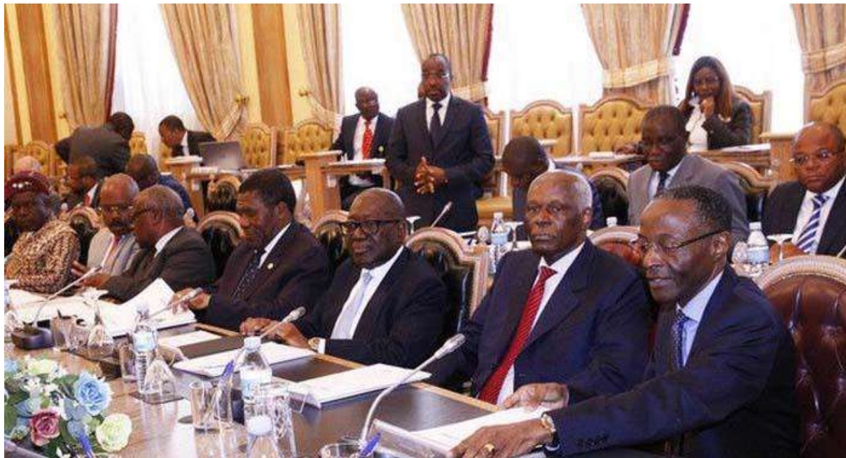
Première réunion des membres du Conseil de la République

Le Conseil de la République recommande la prise en compte de la réalité de chacune des municipalités, dans les différentes étapes du processus préparatoire, pour l'organisation graduelle des élections locales", ajoute le communiqué final de la réunion, qui ne précise pas un calendrier précis. Soulignant la nécessité de définir les critères de sélection du premier groupe de municipalités pour l'expérience initiale, le communiqué cite les municipalités urbaines et rurales, les plus peuplées et les moins peuplées, le stade de leur développement, et celles ayant plus de capacité de collecte d'impôts.