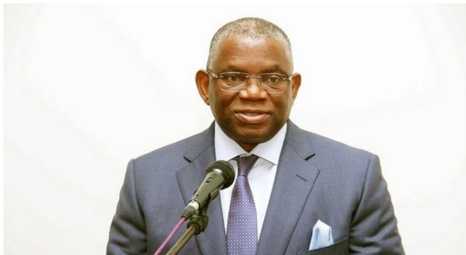
→ George Chikoti, ministre angolais des Relations extérieures, au sommet de Dili (Timor oriental)

La réunion était présidée par le ministre timorais des Affaires étrangères et de la Coopération internationale, Hermani Coelho, également président en exercice dudit Conseil. Les États membres ont planché sur une nouvelle vision stratégique de la CPLP, de la mondialisation, de la question de la mobilité des citoyens au sein de la CPLP et de la nouvelle vision de coopération post-2015.