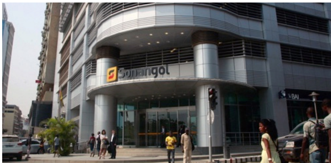
→ Siège social de la société Sonangol

L'appel d'offres porte sur sept blocs situés dans le bassin du fleuve Kwanza et trois blocs dans le bassin du Congo qui renfermeraient, au total, plus de 6,5 milliards de barils de réserves, soit le tiers des réserves connues de l'Angola.