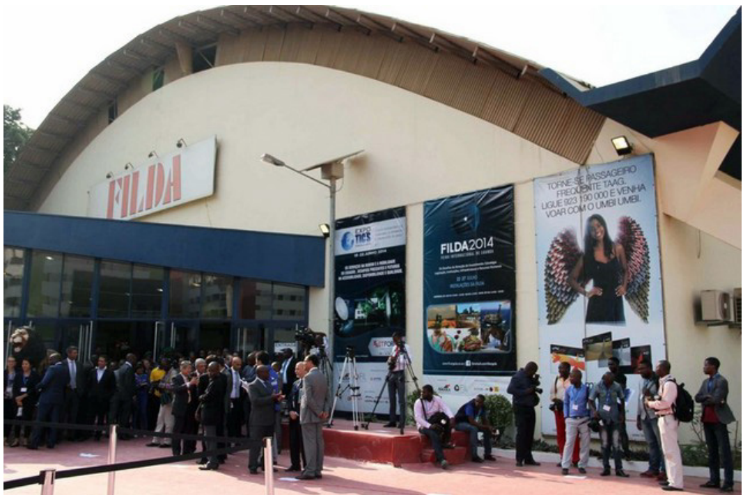
→ La Foire internationale de Luanda

40 pays ont participé à la 32e édition de la Foire internationale de Luanda, FILDA 2015, du 21 au 26 juillet, sur le thème « Le dynamisme, la créativité et la compétence dans la production nationale, une condition préalable pour l'industrialisation et la diversification de l'économie nationale, et un défi pour l'esprit d'entreprise des jeunes ». Parmi les participants figuraient le Brésil, la Chine, l'Égypte, l'Espagne, la France, l'Inde, l'Indonésie, le Japon, Macao, le Nigeria, le Sénégal, La Turquie et la Zambie.