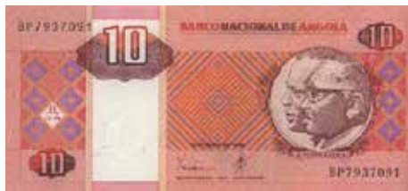
→ Le kwanza, la devise angolaise