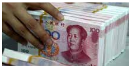
→ Le yuan, la devise chinoise

Un accord monétaire a été conclu entre Luanda et Pékin sur l'acceptation réciproque de devises de deux pays. Selon les termes de cet accord, la monnaie chinoise, le renminbi, pourra être utilisée en Angola, de même le kwanza, la monnaie angolaise aura cours légal en Chine.