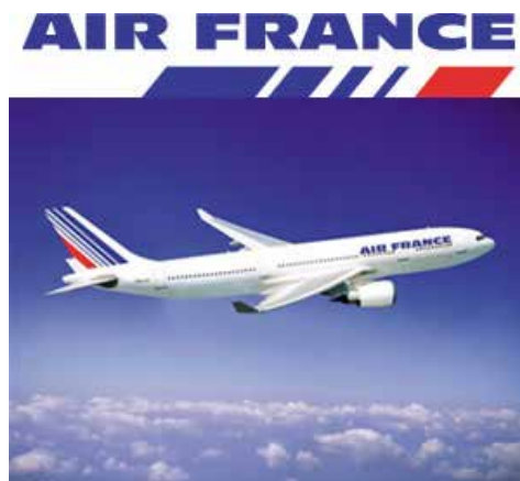
→ La compagnie Air France

C'est à la suite du voyage officiel de François Hollande, au début du mois de juillet, que les consultations entre les autorités aéronautiques de la France et de l'Angola ont été relancées. Elles ont eu lieu les 23 et 24 juin 2015.