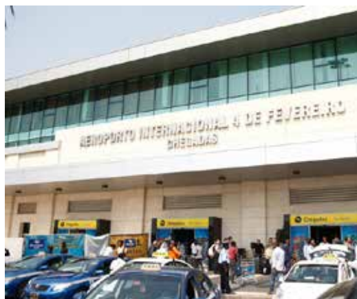
→ Aéroport international de Luanda

À partir du mois d'octobre prochain, Air France augmentera la fréquence de ses vols au départ de Paris-Charles de Gaulle vers Luanda. Il y aura désormais un vol supplémentaire, soit trois vols hebdomadaires.