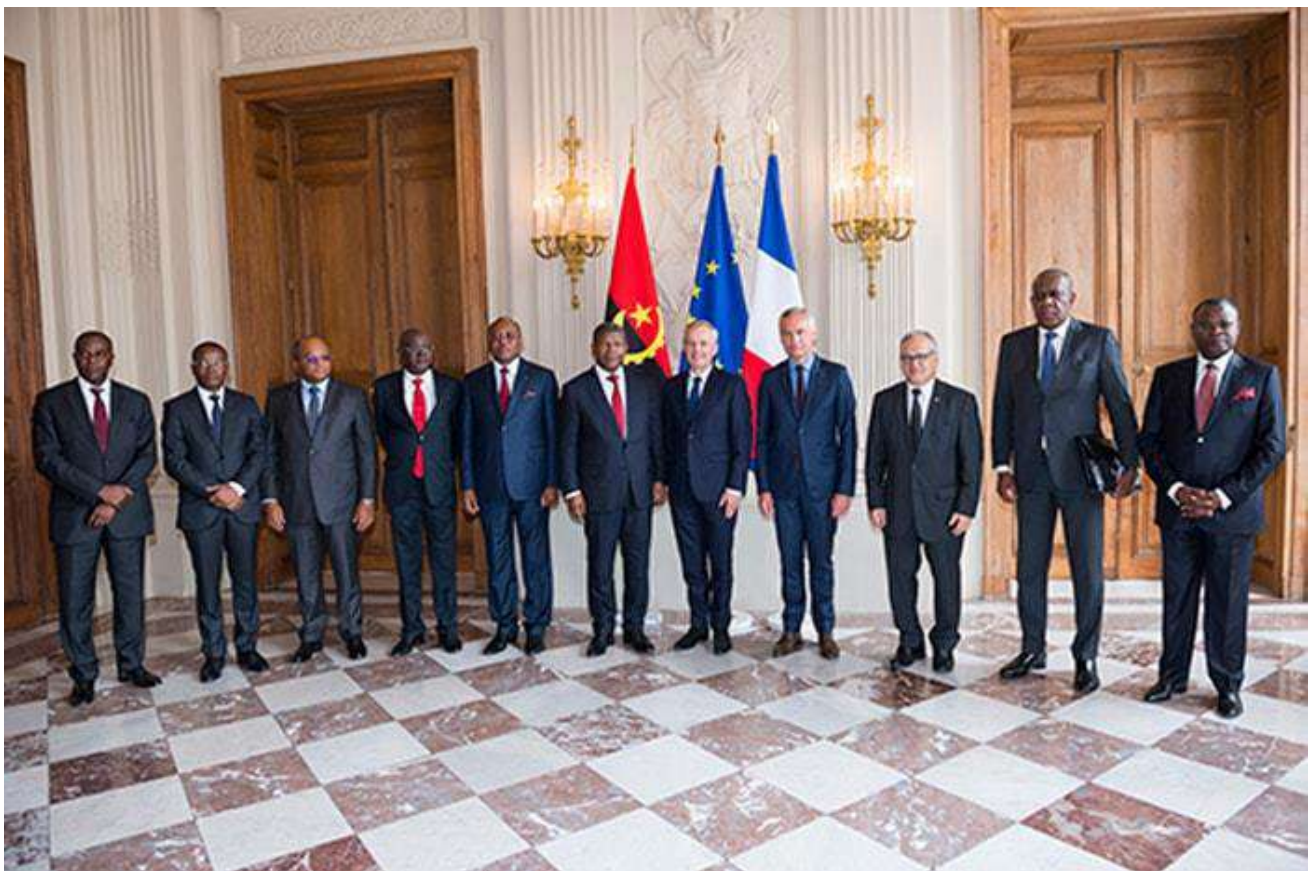
Rencontre au parlement français

De sa part, le Président français a montré son entière disponibilité pour renforcer la coopération avec l'Angola, affirmant que son homologue aura tout son appui pour développer les secteurs d'intérêt commun. "La France accompagne et encourage l'engagement de l'Angola dans la stabilisation des sous-régions africaines, principalement en Afrique Centrale et Australe », a-t-il dit.