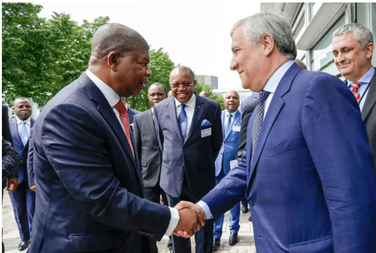
Le président angolais reçu par le président du parlement européen

Selon João Lourenço, les fils de l'Afrique traversent actuellement la méditerranée au péril de leur vie pour fuir les conflits armés, la faim et la misère qui sévissent dans certains des pays, le chômage et le manque de perspectives pour un avenir meilleur du continent. Par conséquent, João Lourenço a appelé l'Union européenne à mettre en place, sur le continent africain, un modèle de coopération pour inverser le cadre actuel et d'aider les pays africains à passer de simples exportateurs de matières premières en producteurs de produits fabriqués et transformés, comme garantie d'une plus grande offre d'emplois et d'opportunités d'affaires.