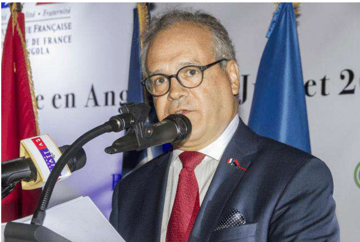
Sylvain Itté, ambassadeur de France en Angola

Selon l'ambassadeur de France, le sommet de l'OIF prévu pour la capitale arménienne sera la 19e édition de cette réunion organisée tous les deux ans et se tiendra du 11 au 12 octobre prochain.