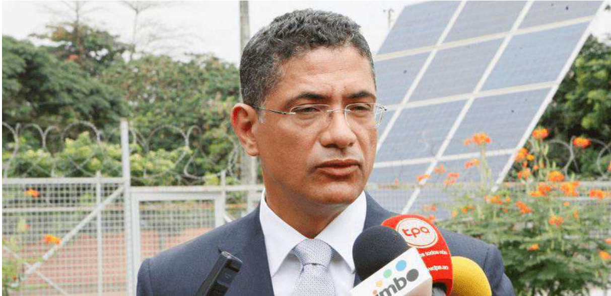
Le ministre de l'Énergie et de l'Eau, João Baptista Borges

Avec les sources de production d'énergie renouvelable, selon João Baptista Borges, les coûts sont économisés, surtout maintenant que le pays connaît une crise économique et financière. Il a informé qu'il existe des initiatives privées, complémentaires avec la stratégie définie par le gouvernement, visant à fournir des services d'énergie propre.