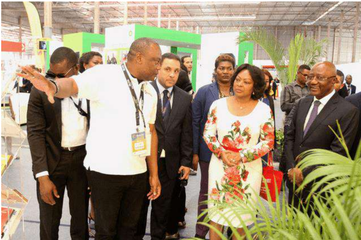
La première dame angolaise visitant les stands de la Foire internationale de Luanda

Diverses activités sont prévues sur le programme, telles que la cérémonie d'ouverture, des ateliers, des lancements de produits, la célébration de la journée nationale des pays et des activités culturelles.